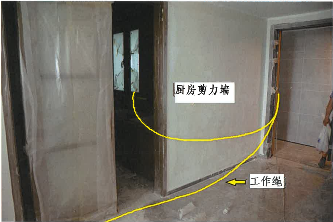
图二 第20层工作绳捆绑固定在厨房剪力墙上的位置