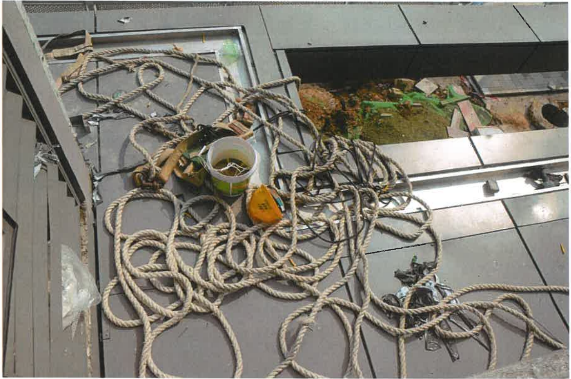
图六 韦某宾坠落二楼雨篷位置及散落的工具