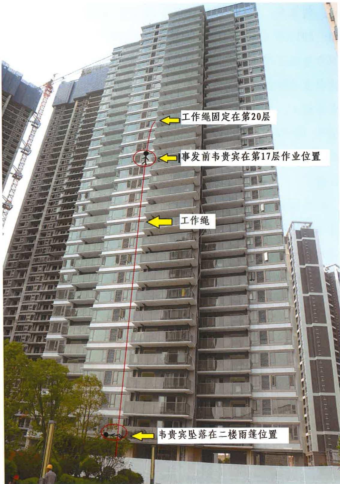
图一 保利中心 2#楼全貌及事发时实况