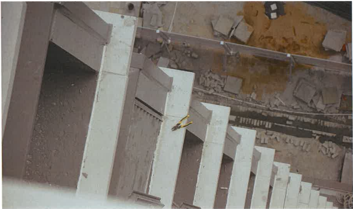
图五韦某宾坠落前在第 17 层检修百叶门时的位置及遗留的工具