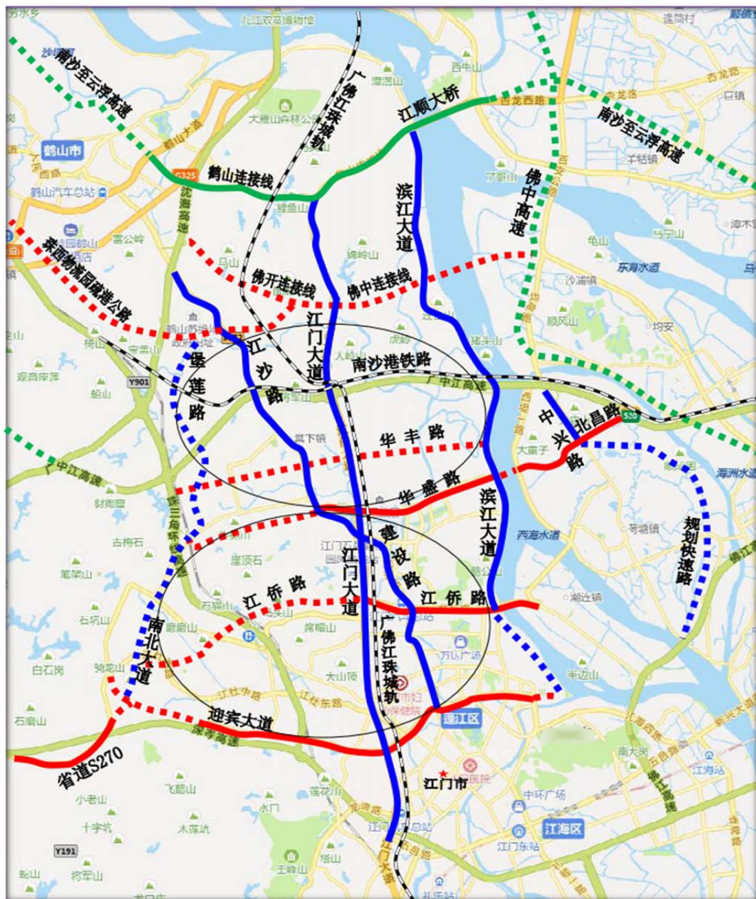
蓬江区“五横五纵两环”道路示意图

连接南北、贯通东西的轨道交通网络。积极配合江门市与广州、佛山、中山、珠海轨道交通合作，融入城际铁路、市域（郊）铁路发展，推动区域轨道交通一体化建设；配合建设珠江肇高铁和启动城市轨道交通1号线、2号线一期等相关铁路工程。