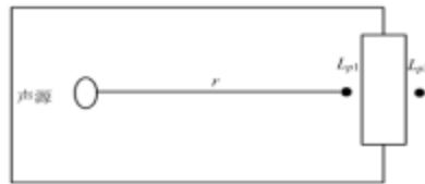
图3. 室内声源等效为室外声源图